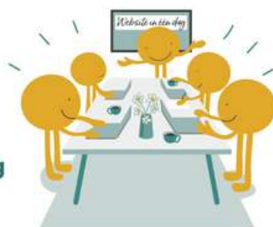
Zelf bouwen in één dag