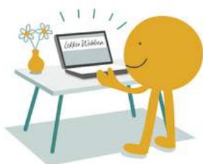
Zelf bouwen met behulp van online training

Stem je keuze af op je specifieke behoeften, budget en ambities voor je bedrijf.